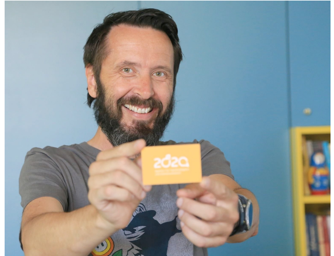
Alexander Balow Photo By Agentur 2020 https://2020.de/

Was heißt zielgruppenspezifische Kommunikation und wie wende ich sie sinnvoll an, insbesondere in Bezug auf die Klimavision?