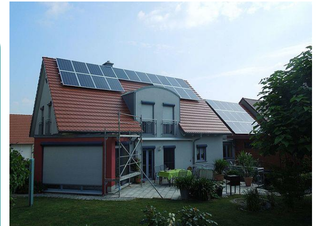
Solarförderung in Osnabrück durch das Programm „Photovoltaik-Plus“ Einfamilienhaus mit PV-Anlagen