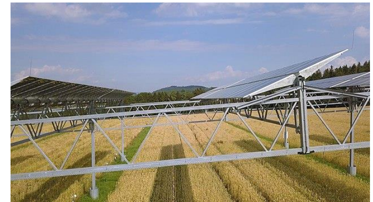
Agri-PV Anlage in Heggelsbach