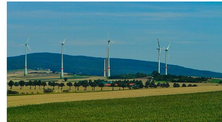
Windräder am Ruhbrink