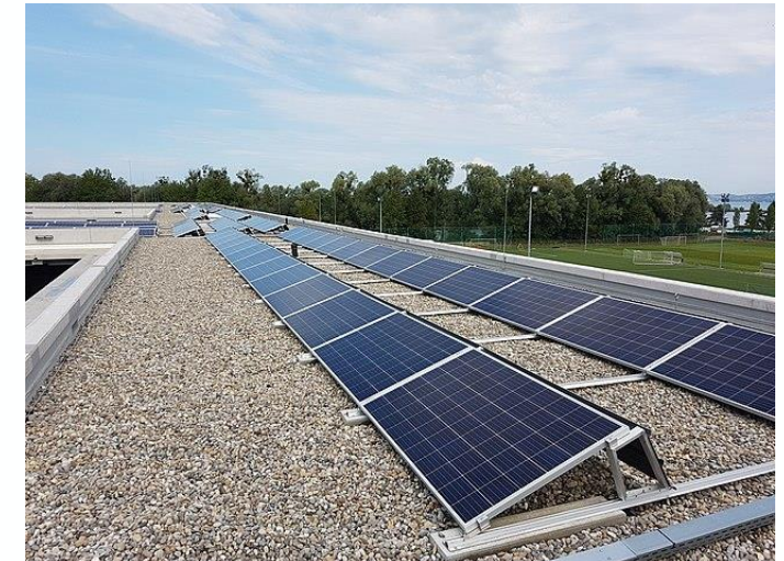
Dach-PV-Anlage auf einer öffentlichen Schule

Stadt- oder Gemeinderat (politischer Beschluss), Kommunale Verwaltung (Ausführung), wenn vorhanden: Stadtwerke, Wohnungsbaugesellschaft en und Energiegenossenschaften (Umsetzung)